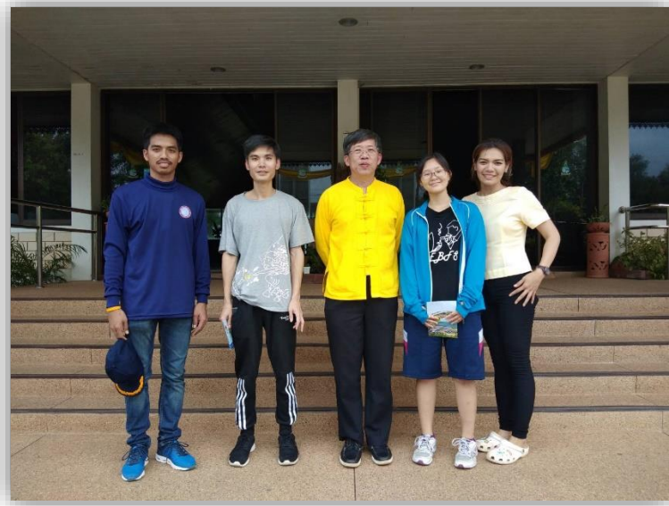
圖一 與接待人員合照

業或是田野調查 1 等，觀察其製造流程與實體販售及營業方式在國外會是什麼樣的方式。