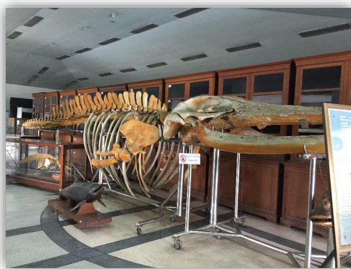
圖三 參訪 Kasetsart University 魚類博物館

為泰國農業大學，是海大姊妹校，具有漁業部門和魚類博物館。而在交流中發現國外的教學環境真的很厲害，不僅占地大，其所展示的內容也豐富許多，也許要思考台灣在占地小的限制下，該如何裝下充足的教學資源與教學環境。