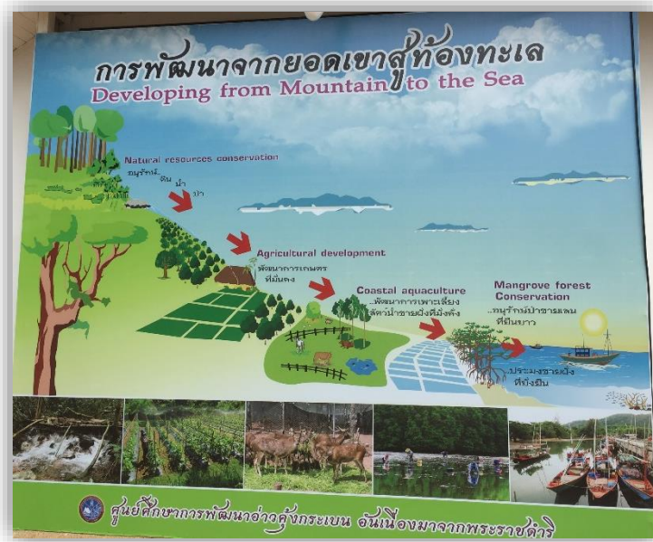
圖六 由山到海的友善開發

最後，在泰國除了這三大參訪地點還有去其他賣場與生鮮市集及買當地路邊攤販的食物，其所遇到的形形色色人群，無論是專業人員還是一般民眾(賣東西的攤販)都英文不錯，可以順暢溝通，讓人不禁要反思台灣的英文是真的該加強了。